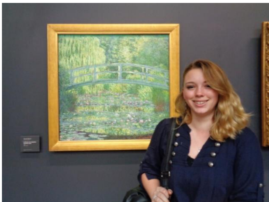
Maewenn & Claude Monet

L'auteur met en scène les métiers manuels dans cette toile, ce tableau semble très réaliste et pas impressionniste et en même temps... on voit la longueur un peu exagéré des bras des ouvriers ainsi que la perspective un peu trompeuse de la pièce.